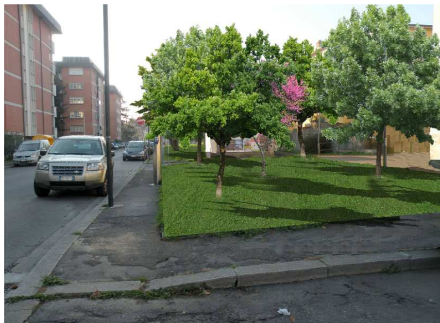
Giardino via Reims