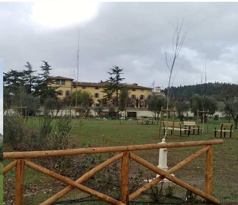
Giardino di via Dazzi