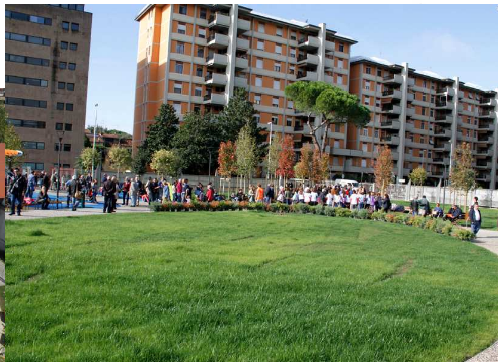
Giardino area ex Meccanottesile