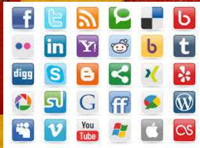
Monitoraggio Social Network