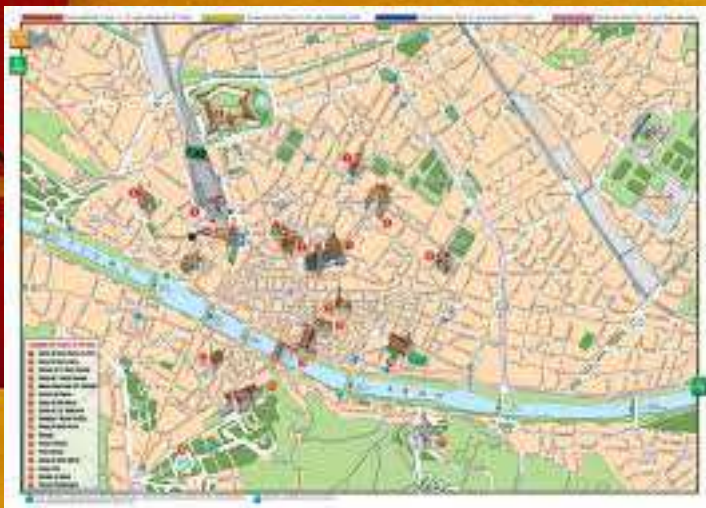
Analisi del territorio

Per contrastare il fenomeno dei Writers si è scelto di basarsi sull'approccio adottato da realtà che già da anni lo hanno affrontato con successo. Appoggiandosi all'esperienza dei colleghi dell'Unità Tutela Decoro Urbano della Polizia Locale di Milano la fase preliminare del lavoro ha previsto due filoni di indagine principali