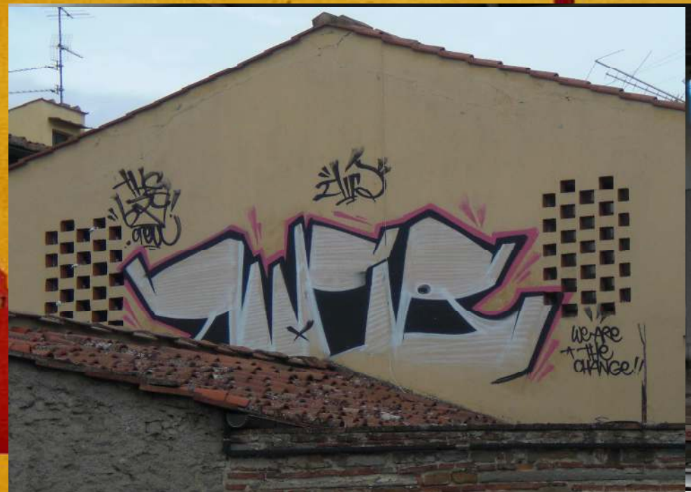
Via Baccio Bandinelli

Durante il 2015 sono stati effettuati numerosi interventi volti ad accertare la realizzazione di graffiti su tutto il territorio comunale al fine di monitorare l'attività di Writers e Crews. Sulla base dei dati raccolti è stato possibile creare dei fascicoli contenenti deturpamenti attribuibili ad un singolo autore o gruppo.