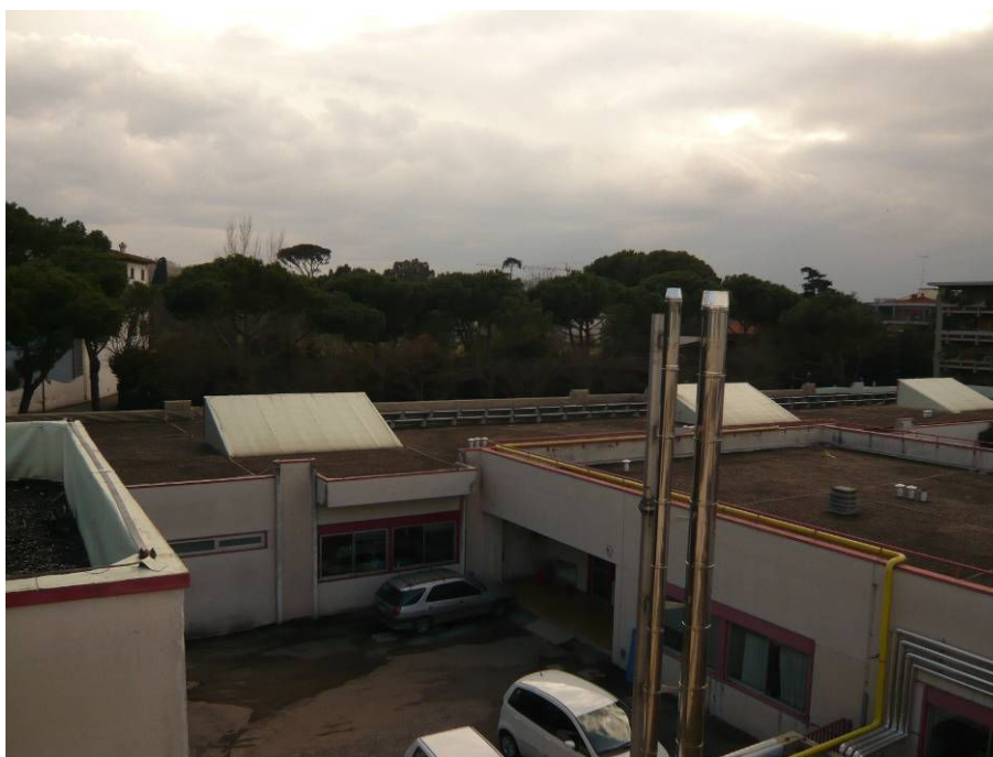
PRIMA (copertura scuola dell'infanzia e uffici)