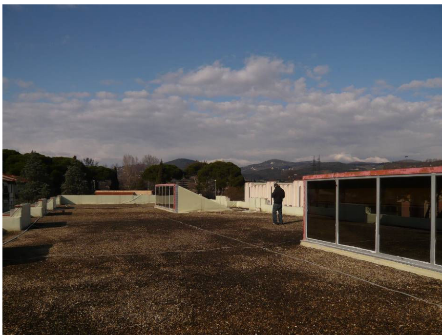
PRIMA (copertura scuola primaria lato Via Svizzera)