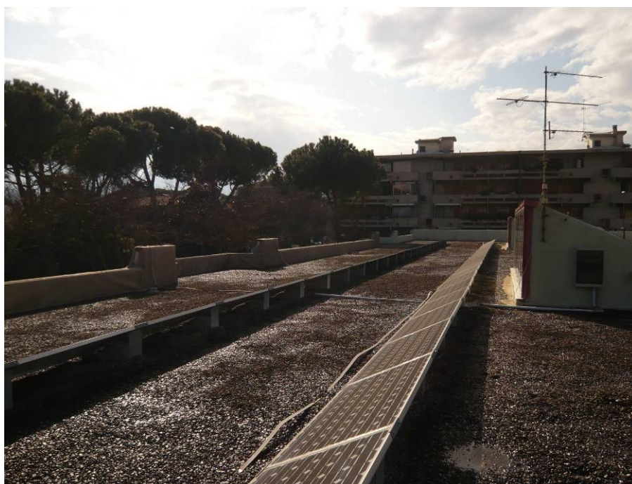
PRIMA (copertura scuola dell'infanzia)