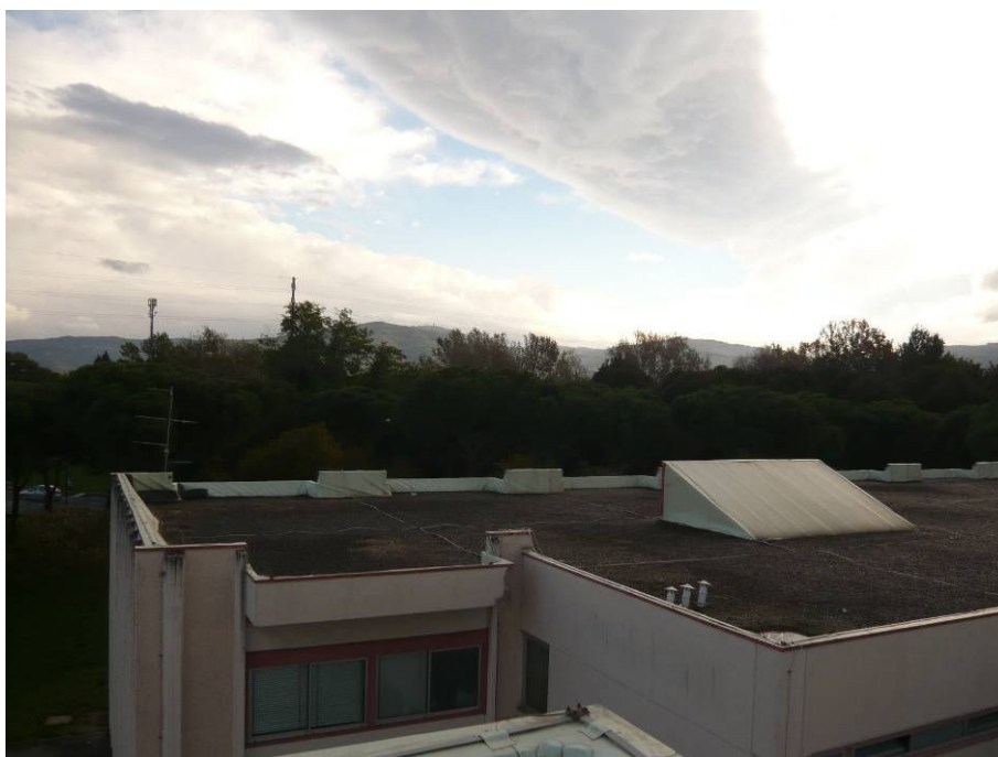
PRIMA (copertura scuola primaria lato Via del Bisarno)