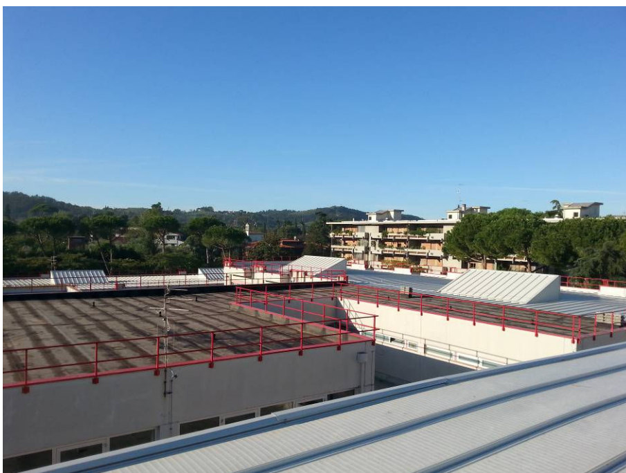
DOPO (copertura palestra e scuola primaria lato Via Svizzera)