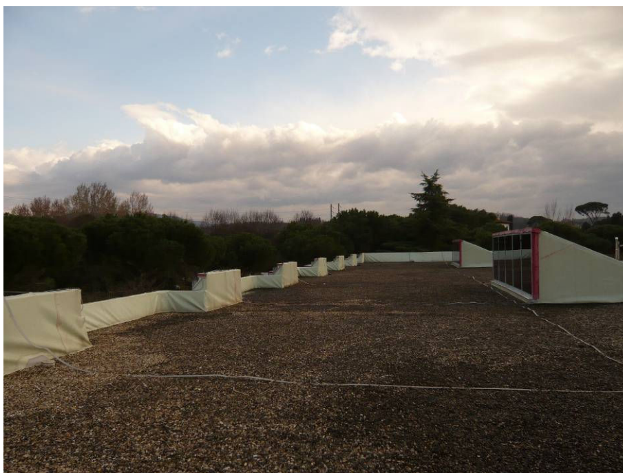
PRIMA (copertura scuola primaria lato Via del Bisarno)