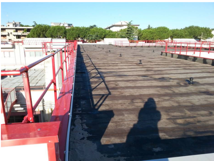
DOPO (copertura corpo centrale – palestra)