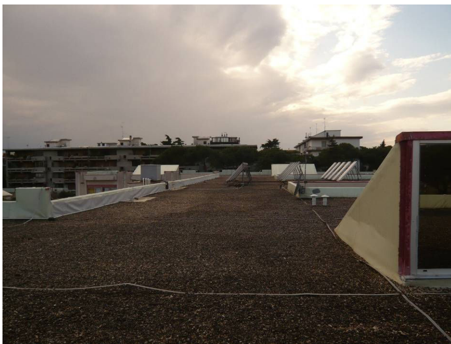
PRIMA (copertura corpo centrale – palestra)