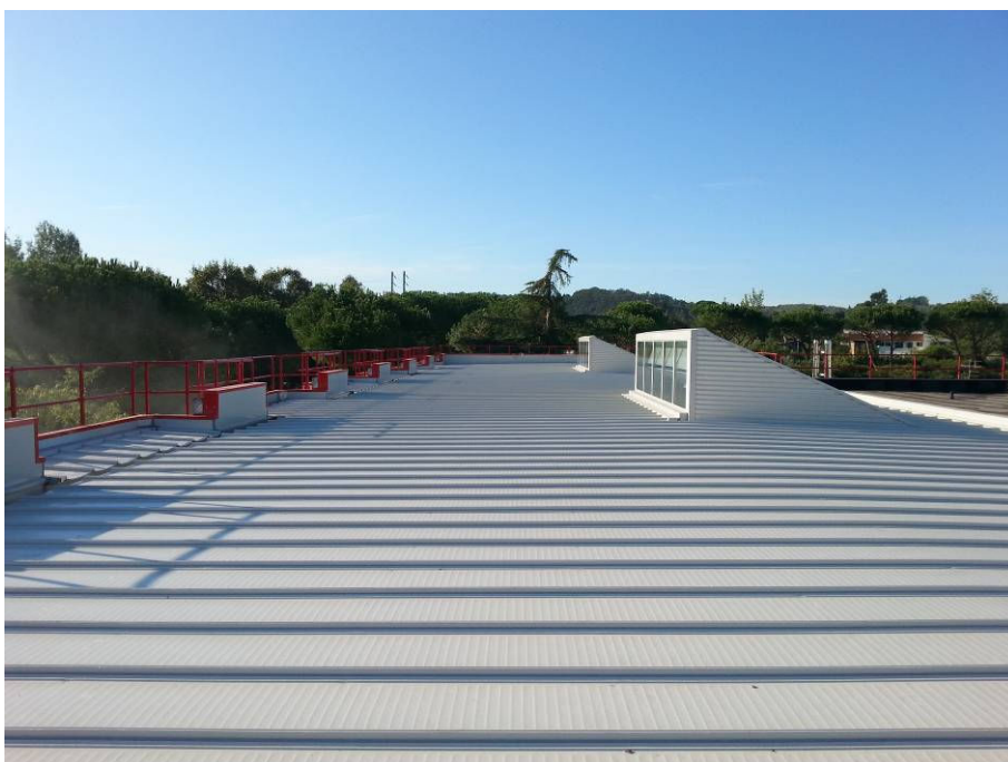
DOPO (copertura scuola primaria lato Via del Bisarno)