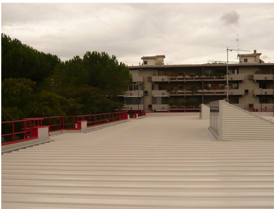
DOPO (copertura scuola dell'infanzia)