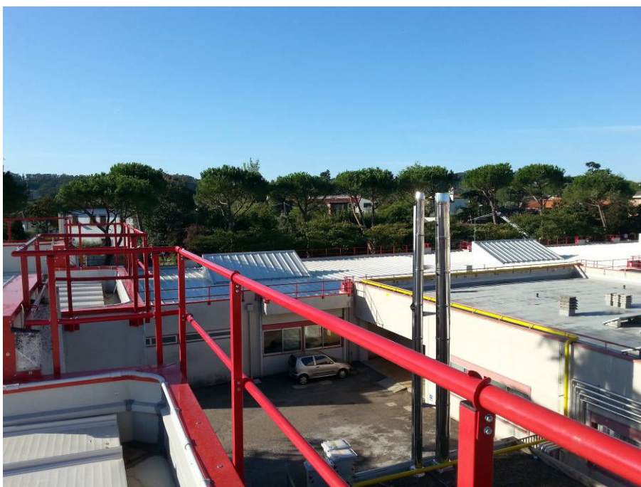
DOPO (copertura scuola dell'infanzia e uffici)