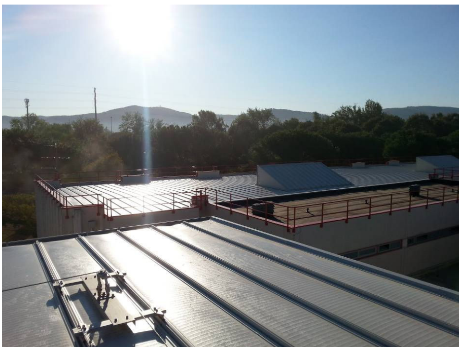
DOPO (copertura scuola primaria lato Via del Bisarno e particolare linea vita palestra)