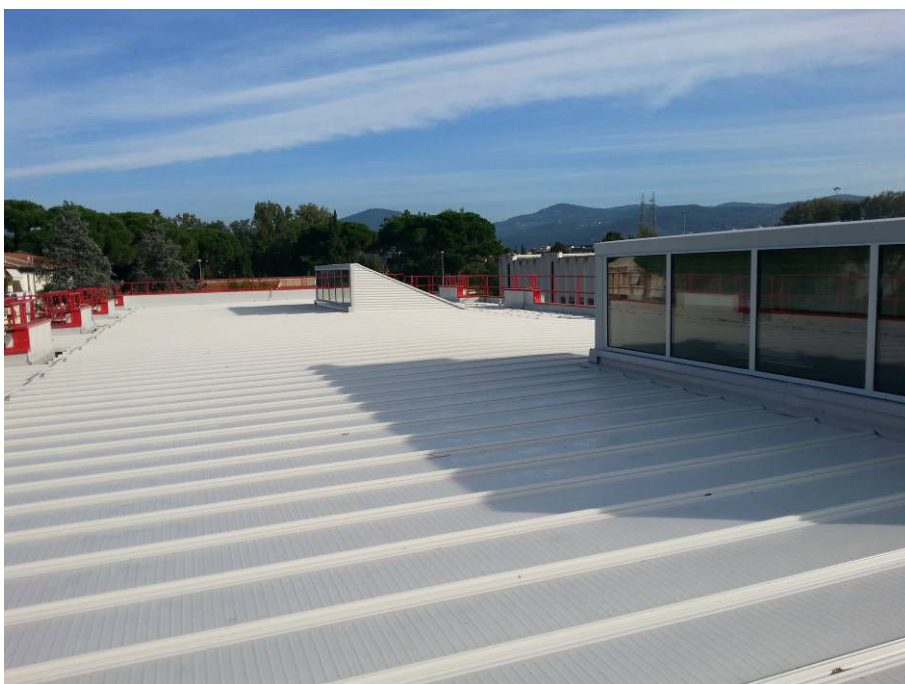
DOPO (copertura scuola primaria lato Via Svizzera)