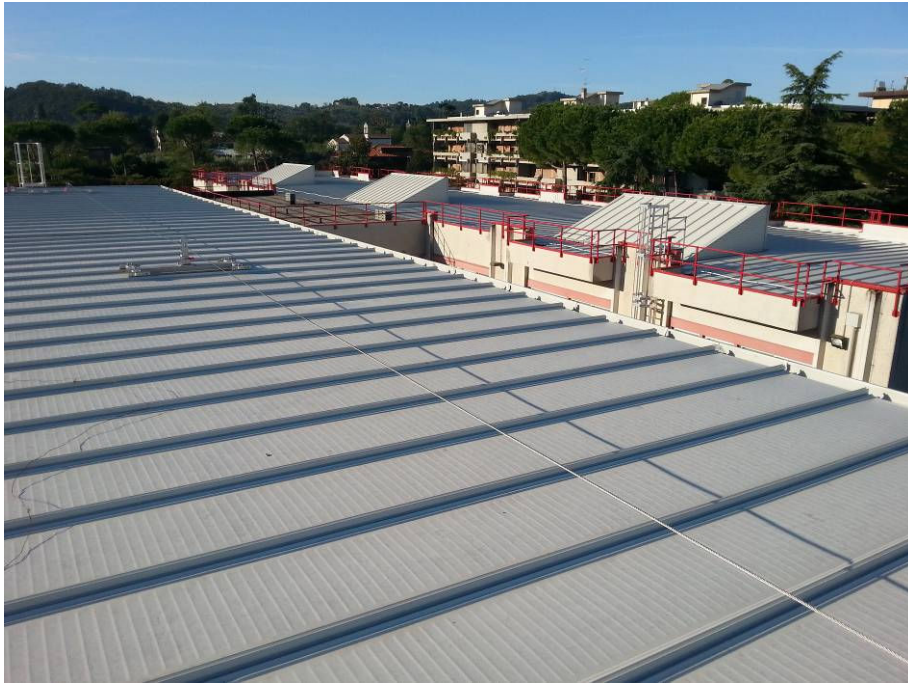
DOPO (copertura della palestra)