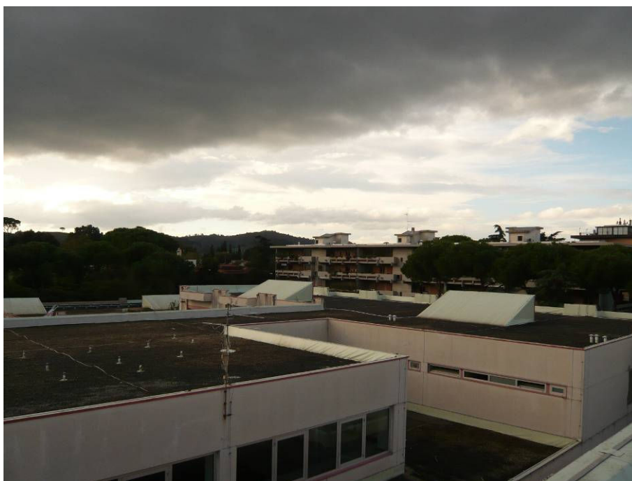
PRIMA (copertura palestra e scuola primaria lato Via Svizzera)