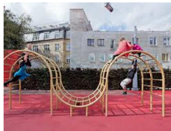
Il Parco e i giochi