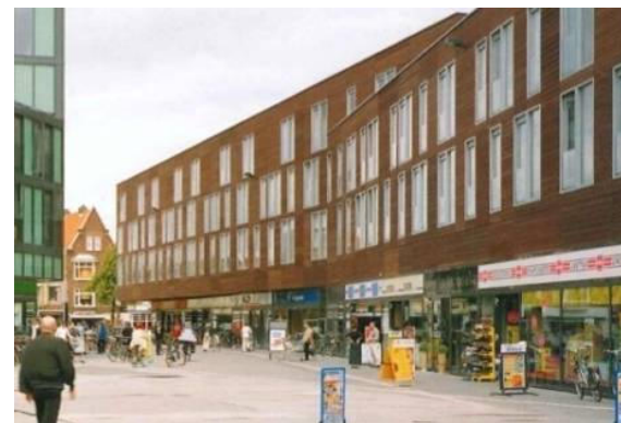
Il commercio al piede degli edifici