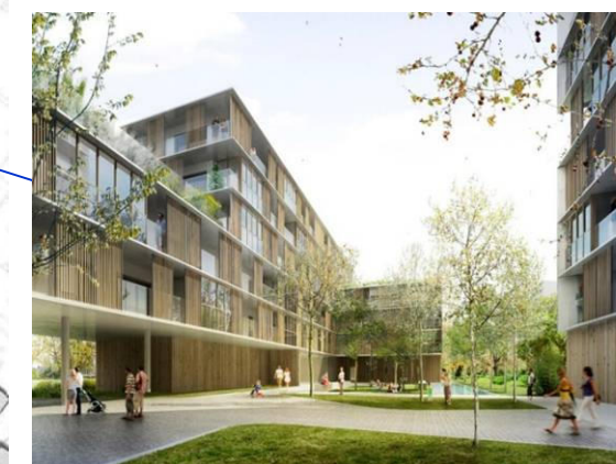
Spazio pubblico di quartiere