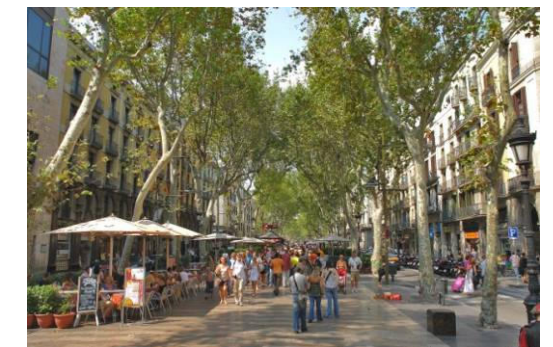
Lo spazio pubblico di quartiere