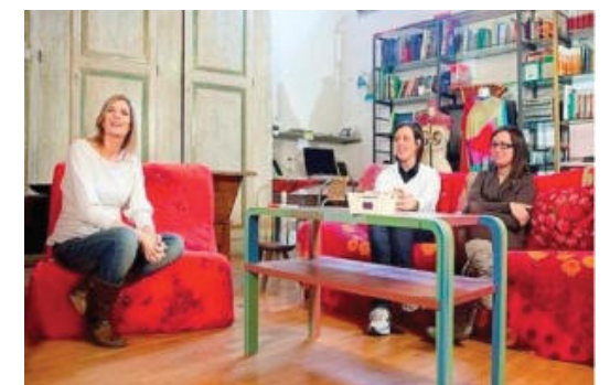
Living di quartiere

Servizi alla persona come ad esempio: Borgo assistito Ambulatorio Palestra